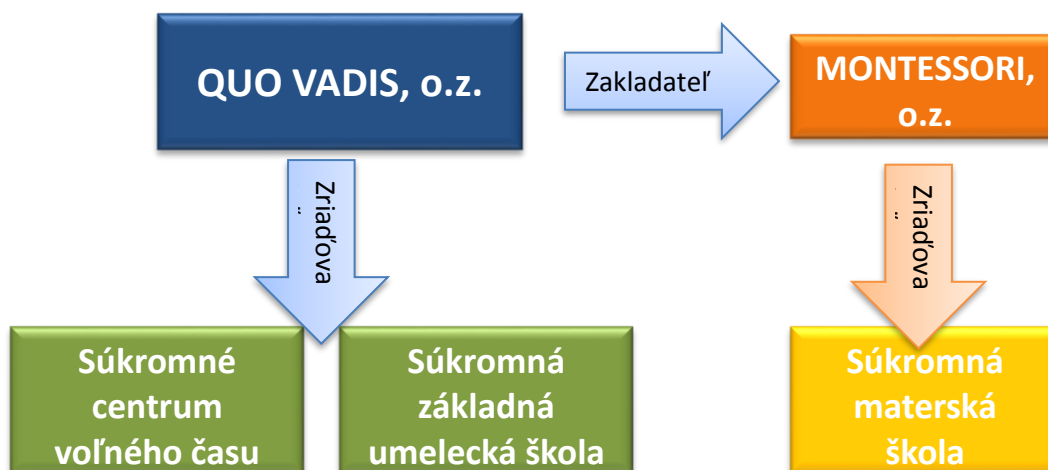
Graf č.1: OZ Quo vadis ako zriaďovateľ a zakladateľ ďalších subjektov

Programové vymedzenie občianskeho združenia: