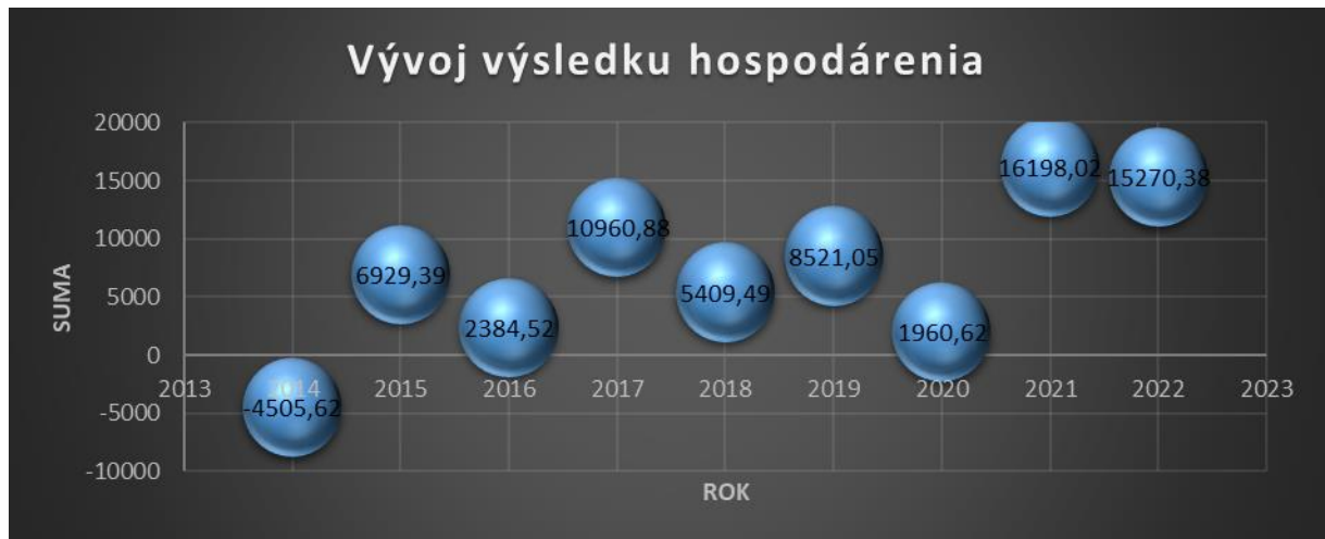
Hospodársky výsledok za posledné roky.

spoločný HV za organizáciu. Hospodársky výsledok sa každý rok presúva do nevysporiadaného výsledku hospodárenia minulých rokov, kde sa kumulujú všetky straty a zisky za obdobie od vzniku združenia.