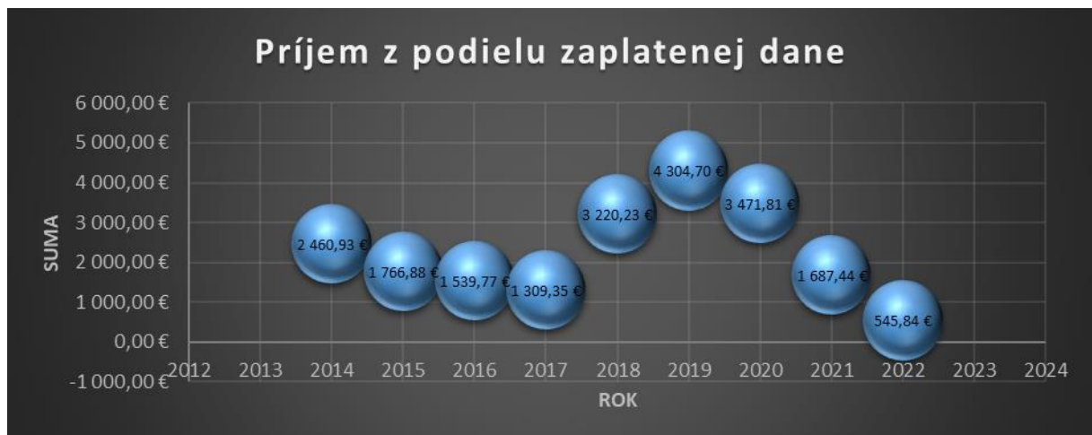
Príjem z podielu zaplatenej dane za posledné roky.

545,84 EUR, z roku 2021 nám ostala suma z 2% dane ešte 1 687,44 EUR, z ktorej sa použila časť v hodnote 1 687,44 EUR na podporu a rozvoj športu, vzdelávania a projektovej činnosti, časť sa presunula do školských zariadení, a to do SZUŠ Quo vadis v hodnote 400 EUR a do SCVČ Quo vadis v hodnote 400 EUR na vzdelávací proces. Zvyšná nespotrebovaná časť z 2% dane v hodnote 545,84 EUR bola presunutá do roku 2023. V roku 2022 sme pokračovali v realizácii projektu pod názvom „Zlepšovanie študijných výsledkov a kompetencií žiakov v Špeciálnej základnej škole vo Zvolene,“ ktorý je podporený MŠVVaŠ SR v celkovej sume 152 000 EUR. Tento projekt z dôvodu nepriaznivej epidemiologickej situácie na území SR bol pozastavený, ale od 06/2021 došlo k jeho znovuspusteniu. V roku 2022 sme vyčerpali, len časť tejto dotácie, a to v hodnote 57 331,68 EUR. Do roku 2023 sme presunuli nespotrebovanú časť dotácie v hodnote 18 405,78 EUR. Občianske združenie sa v roku 2021 a 2022 tiež zapojilo, ako partner do projektu pod názvom „ROMA LGBT,“ realizácia tohto projektu sa začala, len na konci roka 2020 a projekt bol ukončený v roku 2022. V roku 2022 sme získali podporu dvoch projektov - jeden pod názvom „Nádej v komunite“ podporený ÚV SR a projekt „Digitálne vzdelávanie pre každého“ podporeného KULT MINOR.