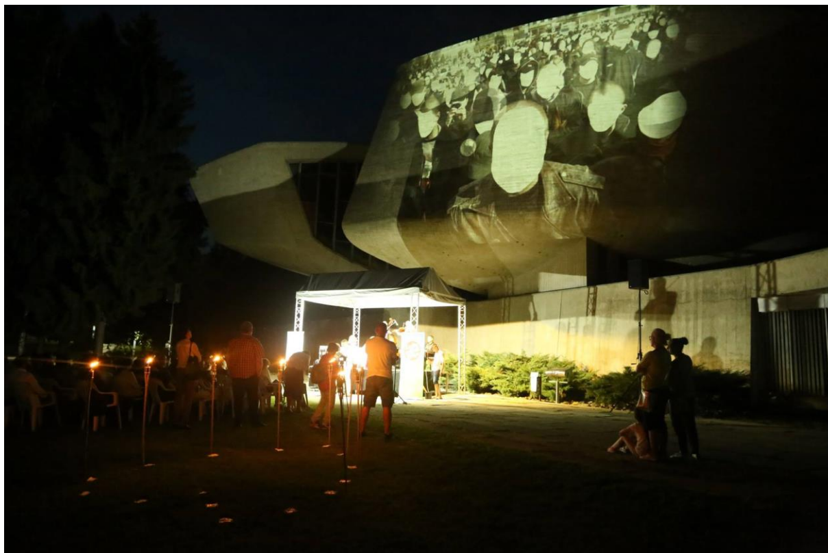
Foto: Piétna akcia k rómskemu holokaustu